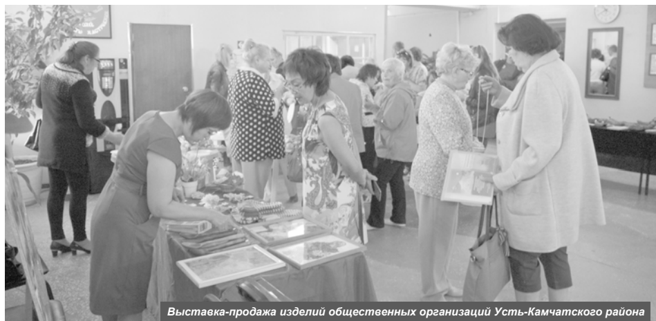
Выставка-продажа изделий общественных организаций Усть-Камчатского района

Такие примеры уже есть. После подобных конференций создаются новые объединения, волонтерские движения. Затем они вместе