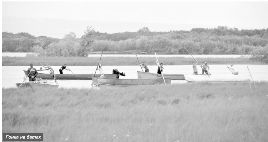
Гонка на батах

А началось торжество с прохождения обряда очищения, в котором приняли участие все желающие. Чтобы задобрить богов реки и призвать их к богатым рыбным уловам, люди, пройдя сквозь импровизированные лесные врата, клали кусочки сахара в будущий костёр и загадывали заветные желания. Затем,